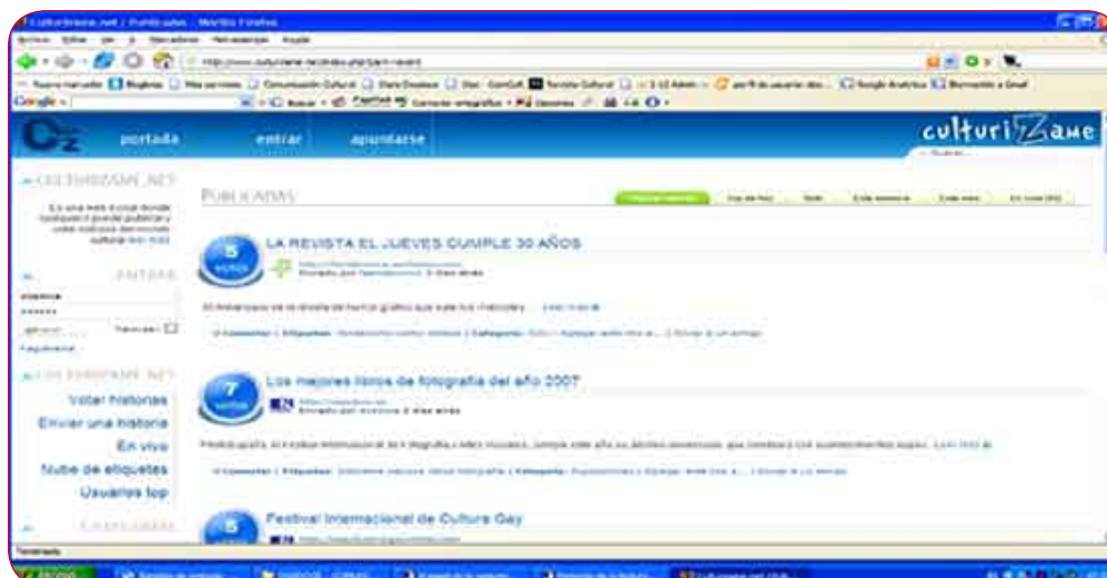
Web social especializada en cultura www.culturizame.net

Todos estos iconos apuntan a servicios web externos que facilitan la gestión de textos, archivos, enlaces, etc. Estos servicios permiten al usuario votar, compartir, comentar o almacenar los contenidos culturales que encuentra en Internet. El uso de estas herramientas en la sociedad civil se está llevando a cabo a una velocidad de vértigo. En los últimos meses, sus usuarios han colgado más de 170 millones de usuarios en Youtube y más de 150 millones de fotos publicadas en la red social de intercambio de fotografías Flickr. Además, se han creado más de 71 millones de blogs y se han publicado cerca de 6 millones de artículos en la enciclopedia Wikipedia .